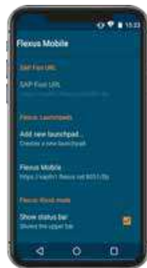
theflex. mobile browser for SAP

theflex. unterstützt Sie bei der Optimierung ihrer Logistikprozesse