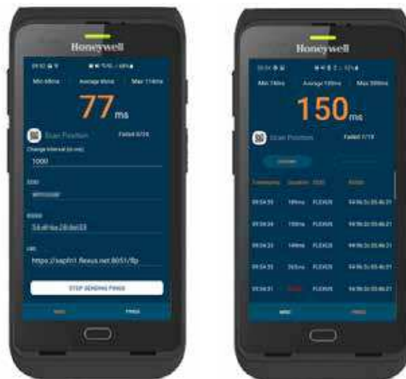
Netzwerkanalyse direkt in the flex .

Diese besondere Erweiterung bietet Ihnen im laufenden Betrieb die Kontrolle und Überwachung Ihres Netzwerkes (Zeitpunkt, Dauer, SSID, BSSID, Position, URL, Fehlermeldungen). Mit Scannen des Barcodes an Lagerplätzen oder Maschinen wird die aktuelle Position ermittelt und gespeichert.