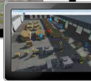
Fahrzeug- und Palettenortung