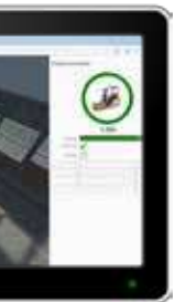
Ortung im Dashboard