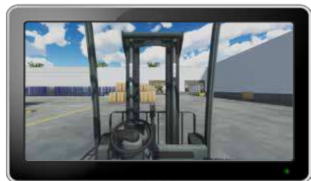
3D-Lagernavigation auf dem Fahrzeug

Dem Fahrer wird auf seinem Terminal die kürzeste Wegstrecke zum Von-Platz angezeigt. Der aufzunehmende Ladungsträger wird farbig markiert und die Aufnahme bzw. das Abstellen automatisch über die Fahrzeugortung registriert.