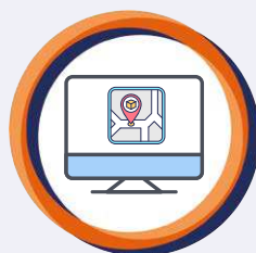
Integration Ortung / 3D-Navigation