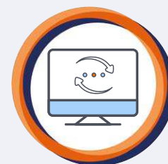
FTS-Integration (fahrerloses TS)