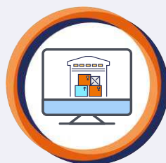
Lagerverwaltung WIP in Produktion