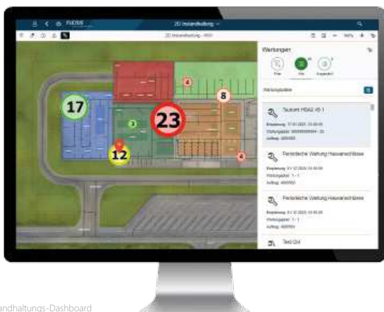
2D-Karte im Instandhaltungs-Dashboard

Über das Flexus Instandhaltungs-Dashboard findet die Überwachung und Administration auf Basis der neuesten SAP-Technologien statt.